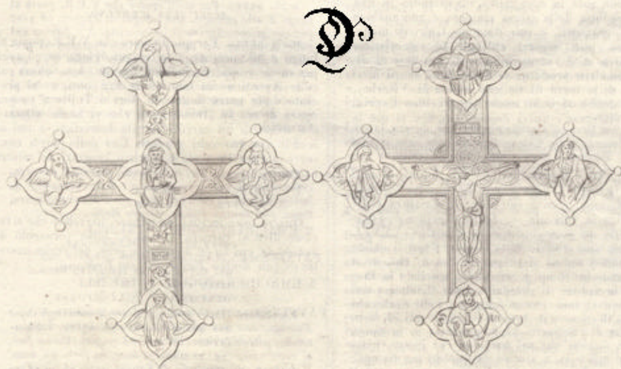
LAVORI D'ORIFICERIA DE' PRINCIPII DEL SECOLO XV. D'ARTEFICE VITERBESE.